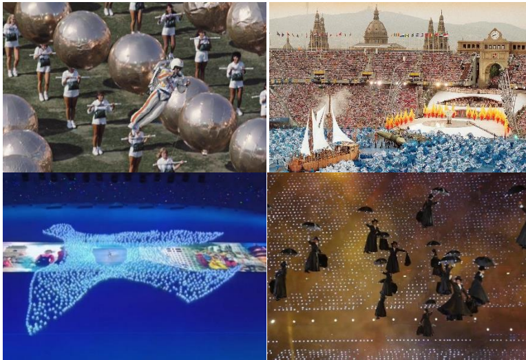
ภาพที่ 3 การแสดงในพิธีเปิดการแข่งขันกีฬานำเสนอรูปแบบนวัตกรรมบันเทิง (ซ้ายบน Kelly Faircloth, 2016; ขวาบน Stephanie Limiti, 2016; ซ้ายล่าง IOC, 2008; ขวาล่าง Yahoo, 2012)

หากวิเคราะห์แนวคิดจากการแสดงพิธีเปิดที่กล่าวไปข้างต้น พบว่า การแสดงพิธีเปิดเหล่านี้ ยังมีแนวคิดย่อยปรากฏอยู่ 4 แนวคิด ได้แก่