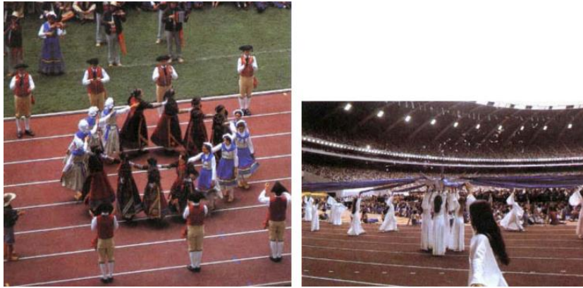
ภาพที่ 2 การแสดงนาฏศิลป์พื้นเมืองของบาวาร์เรียนในพิธีเปิด (Amateur Athletic Foundation of Los Angeles, 1978)

รูปแบบเปลี่ยนไปตามบริบท คือ การแสดงหรือนาฏกรรมที่เปลี่ยนแปลงไปตามแนวคิด โดยนำเสนอผ่านนาฏกรรมในรูปแบบต่าง ๆ เช่น นาฏกรรมกับวัฒนธรรม นาฏกรรมกับประวัติศาสตร์ นาฏกรรมกับเทคโนโลยี ฯลฯ